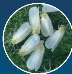
オンシツコナジラミ