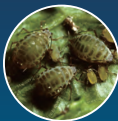
ニセダイコンアブラムシ