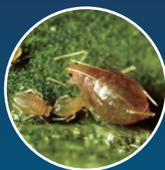
モモアカアブラムシ