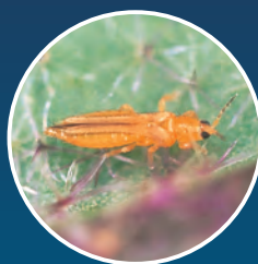
ミナミキイロアザミウマ